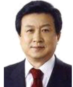
신 기 남 도서관정보정책위원회 위원장